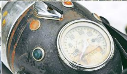
Viel auf der Ice: In rund 50 Jahren dürfte die Menge deutlich mehr als die 20 000 Kihnnus abgeparkt haben