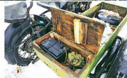
Eigenes Ersatzteil: Wegen der eisigen Temperaturen kommt im Winter oft eine große Autobatterie zum Einsatz